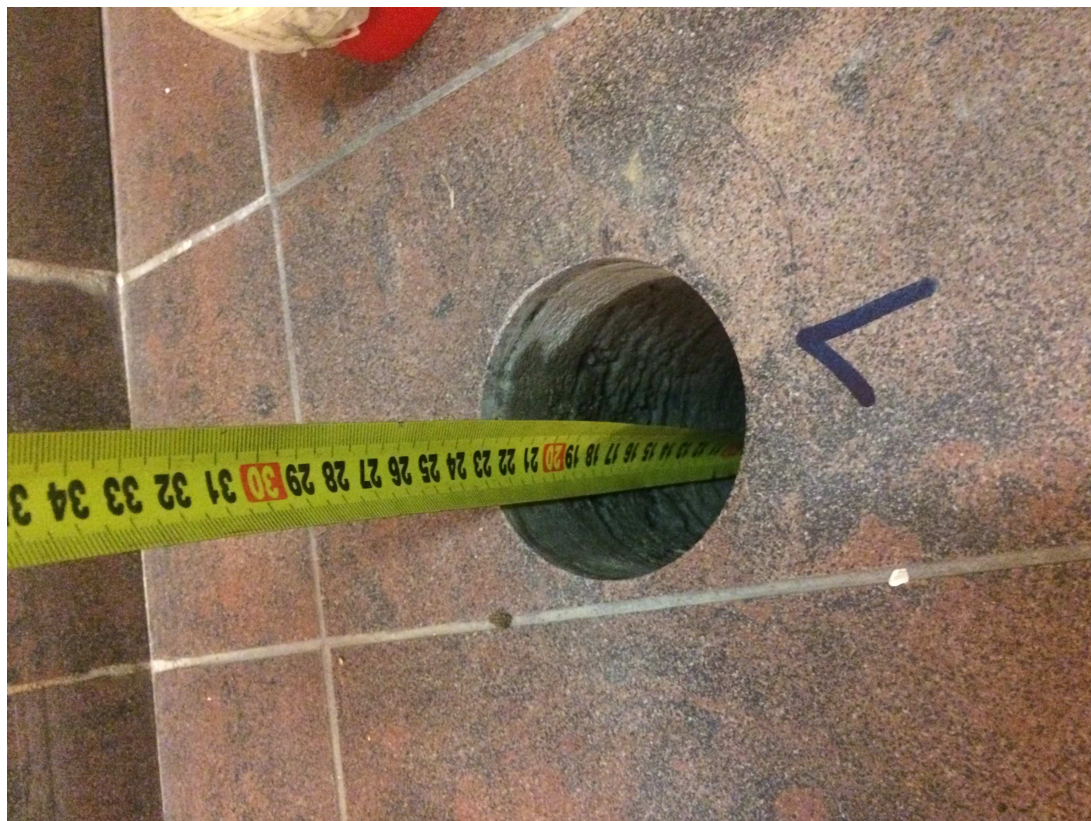
sonda 1 - pod hlavními schody